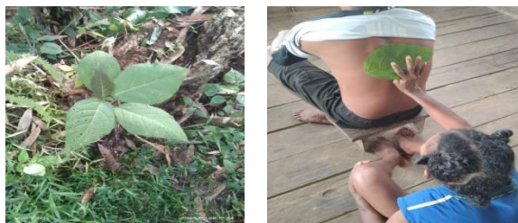
Gambar 1. Tumbuhan Daun Gatal

Daun gatal dipercaya dapat mengobati badan sakit dan menghilangkan rasa nyeri. Cara pemanfaatannya adalah dengan memetik daun yang muda, kemudian langsung digosokkan pada bagian tubuh yang terasa sakit. Meskipun menimbulkan rasa gatal dan panas saat digunakan, justru dipercaya bahwa daun gatal sedang bekerja untuk menghilangkan rasa sakit.