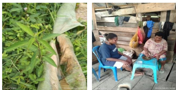
Gambar 2. Tumbuhan Ciremai Sidaguri

Masyarakat Kampung Malawor menggunakan rumput ciremai sidaguri untuk mengobati luka. Pengelolaannya adalah dengan cara dipetik daunnya yang muda, lalu dicuci dan ditaruh dalam suatu wadah atau tempat, kemudian ditambahkan gula pasir sedikit, ditumbuk sampai halus dan langsung diletakkan pada bagian tubuh yang terluka.