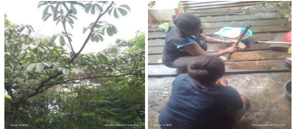
Gambar 5. Pohon Pulai

lainnya. Pohon ini memiliki batang lurus besar, kulit bergetah berwarna putih, daun berbentuk oval dan rasanya sangat pahit.