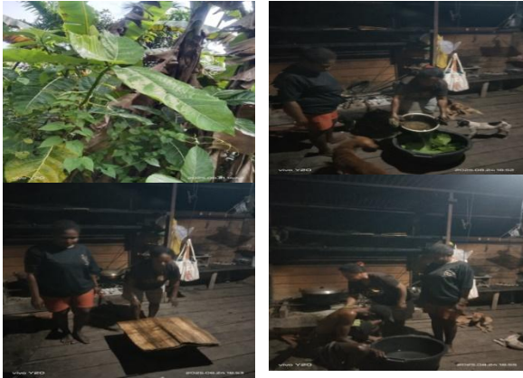
Gambar 3. Awar-Awar

lainnya. Pohon ini memiliki batang lurus besar, kulit bergetah berwarna putih, daun berbentuk oval dan rasanya sangat pahit.