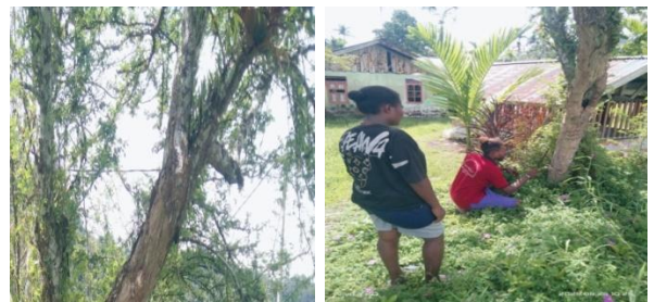
Gambar 6. Kelor

Kelor ( Moringa oleifera ) yang biasanya oleh masyarakat setempat disebut dengan nama Marubek merupakan tumbuhan berkayu, dan termasuk dalam famili Moringa adalah tanaman yang bisa tumbuh dengan cepat. Pohon ini digunakan sebagai bahan makanan dan obat. Pohon kelor berkayu lunak, batang berwarna putih, daunnya berbentuk bulat telur berwarna hijau, dan bunga putih kekuningan. Masyarakat Kampung Malwor pada umumnya mereka menanam pohon kelor disamping rumah untuk kebutuhan pengobatan rematik dan asam urat. Cara pengelolaannya adalah dengan dikupas kulitnya (10 cm atau 1 panggal), kemudian direbus dan diminum.