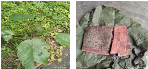
Gambar 4. Pohon Daun Payung

Masyarakat Kampung Malwor pada umumnya menggunakan Pohon daun payung untuk mengobati badan sakit dan tambah darah. Cara pengelolaannya adalah dengan mengambil bagian kulitnya sebesar 10 cm (1 panggal), lalu dikikis bagian kulitnya dan dicuci bagian luarnya. Setelah itu direbus hingga mendidih dan setelah hangat dapat langsung diminum. Untuk pemakaian kulit yang diambil dengan ukuran 10 cm dapat direbus sebanyak 4 kali penggunaan.