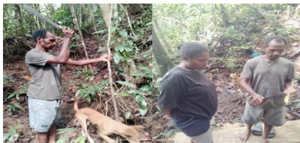
Gambar 8. Tali kuning

Masyarakat Kampung Malawor menggunakan tali kuning untuk mengobati penyakit malaria. Cara pengelolaannya adalah dengan memotong batang tali, lalu dikikis kulit bagian luar, kemudian dipotong kecil-kecil dan dijemur dibawah sinar matahari. Setelah kering bisa langsung direbus hingga mendidih lalu diminum.