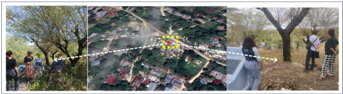
Gambar 4 Survey kondisi Lapangan

Sebelum menyusun desain Situs Memorialisasi, tim terlebih dahulu melakukan survei ke lokasi TPU Oesao, Kabupaten Kupang. Kegiatan ini bertujuan untuk mengetahui topografi tanah dan kondisi eksisting tapak melalui pengukuran, dokumentasi foto, pembuatan sketsa situasi, serta wawancara bersama para penyintas dan tim Jaringan Perempuan Indonesia Timur (JPIT). Selanjutnya dilakukan identifikasi masalah untuk merumuskan desain Situs Memorialisasi yang tidak hanya representatif, tetapi juga mampu memberikan akses bagi penyintas dan keluarga korban dalam melakukan ziarah dengan rasa aman dan tanpa rasa takut.