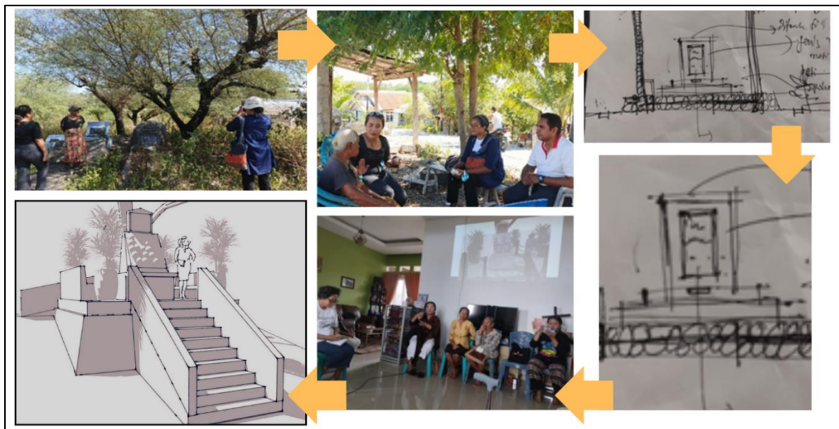
Gambar 3 Proses pembuatan Desain yang partisipatif

Metode pelaksanaan kegiatan ini menekankan pendampingan partisipatif melalui survei, identifikasi masalah, studi kepustakaan, perancangan, serta evaluasi berkelanjutan agar desain Tugu Memorialisasi Situs Pembantaian Tragedi Anti-Komunis 1965/1966 di Oesao dapat terwujud secara representatif, layak, dan bermakna bagi penyintas maupun keluarga korban.