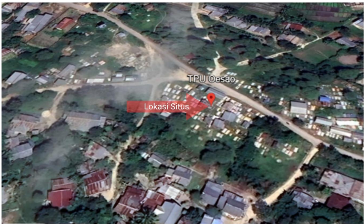
Gambar 1 Lokasi Situs Tragedi Anti – Komunis 1965/1966 di Oesao Kab. Kupang

tanda memorial yang layak. Karena itu, muncul kerinduan agar makam keluarga dapat dikenang secara pantas dan memberi rasa pemulihan bagi mereka. Desain Tugu Memorialisasi Oesao menjadi penting sebagai simbol penghargaan bagi para korban, wadah peringatan bagi keluarga, serta sarana edukasi bagi masyarakat luas mengenai nilai kemanusiaan dan perdamaian. Makna tugu bisa muncul dari Unsur-unsur seni rupa seperti garis, titik, dan bidang menjadi dasar dalam pembuatannya, sehingga mampu memunculkan beragam makna (Morin, 2014). Kehadiran tugu ini diharapkan mampu menjawab kerinduan para penyintas dan keluarga, sekaligus menjadi penanda historis yang bermakna bagi generasi mendatang.